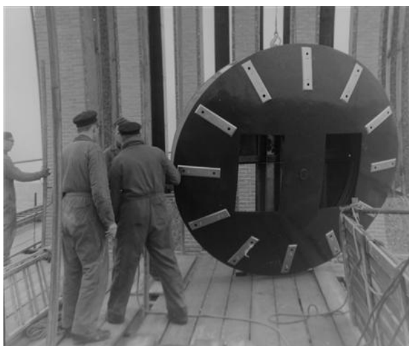
fig. 1 Prepareren van de wijzerplaat voor de klokkentoren (ca. 1964)

Na de ingebruikname functioneert het raadhuis vervolgens tot in de jaren negentig zonder dat er noemenswaardige wijzigingen plaatsvinden. In 1995 wordt er aan de noordzijde van het raadhuis een uitbreiding gerealiseerd naar ontwerp van Greiner en Van Goor Architecten. De uitbreiding wordt met het raadhuis verbonden middels een loopbrug. De hoofdentree van het raadhuis alsmede de publiekshal wordt hierbij verplaatst van het plein 1945 naar de nieuwbouw. In deze periode wordt tevens de achteringang ter plaatse van de Zoutmanstraat (deur met naastgelegen erkerkozijn) verplaatst naar de Raadhuisstraat.