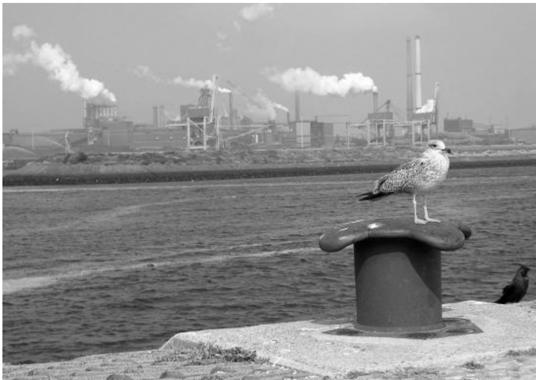
Mens en dier leven samen

De raadsleden gaven een aantal aandachtspunten mee, die in hun ogen in elk geval een plaats zouden moeten krijgen in het beleid.