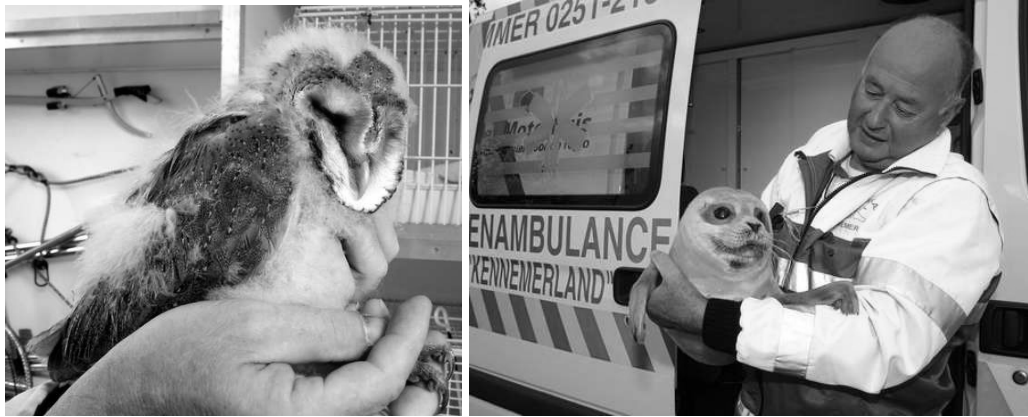
Redding van hulp behoevende, in het wild levende, dieren (kerkuiltje en zeehond)

De dierenambulances beschikken over goed opgeleide vrijwilligers, die bovenstaande taken op professionele wijze uitvoeren.