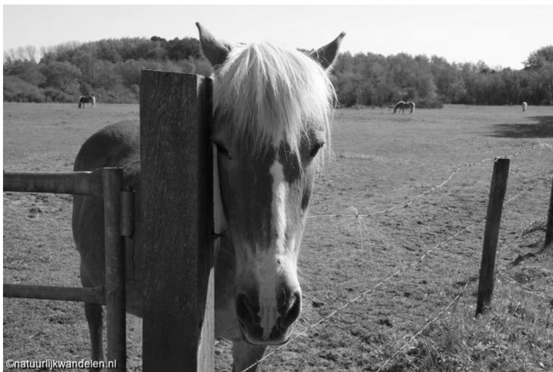
Paarden op landgoed Duin en Kruidberg.

Waar begint en eindigt de verantwoordelijkheid van de gemeente voor het dierenwelzijn? Die vraag is niet eenvoudig te beantwoorden. Ons college wil met deze nota komen tot een eerste aanzet, die zich in de loop der tijd eventueel kan doorontwikkelen en uitbreiden.