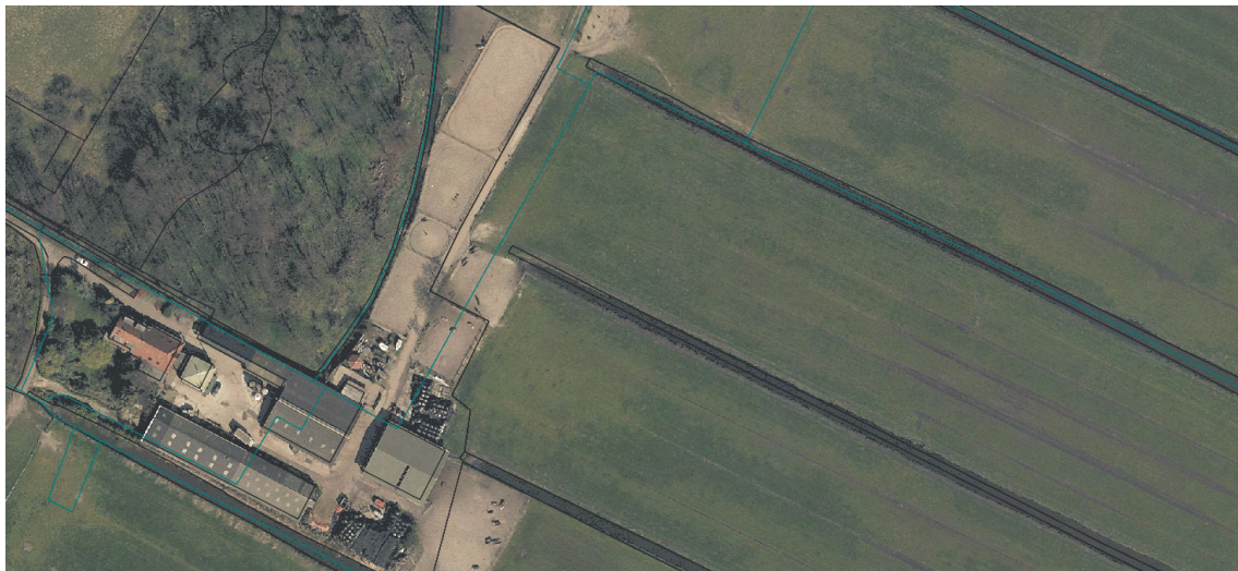
Afbeelding: Luchtfoto 2010

Het houden van pensionpaarden past niet binnen de agrarische bestemming. Agrarisch gebruik is gericht op het voortbrengen van agrarische producten. Als nevenactiviteit is het houden van pensionpaarden toegestaan. Hierbij hoort een paardenbak. Wij vinden het echter niet nodig meerdere kleine paardenbakken mogelijk te maken. Het bestemmingsplan wordt niet aangepast.