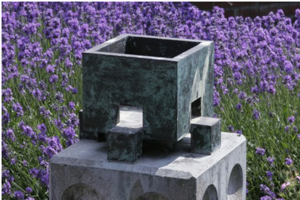
Impluvium 1996, Jeroen van Rijn

Verder zal de Kunstcommissie gevraagd worden te adviseren bij projecten met betrekking tot inrichting van de openbare ruimte.