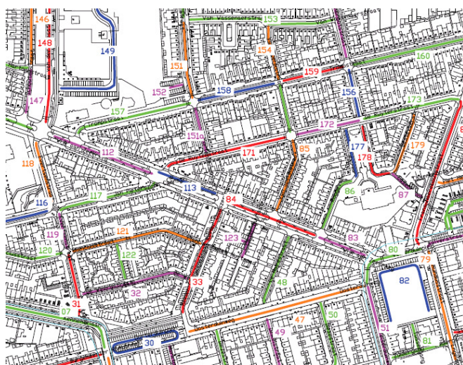
Afbeelding 1: wegen in IJmuiden ingedeeld in secties

thuis) en in winkelgebieden veelal op zaterdag.