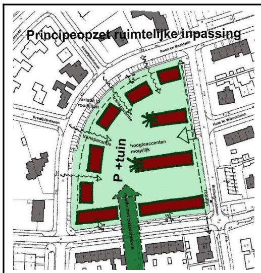
Tekening uit inspraakstartdocument