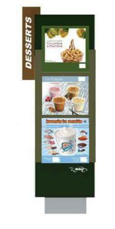
T3-B TOTEM 3B double face