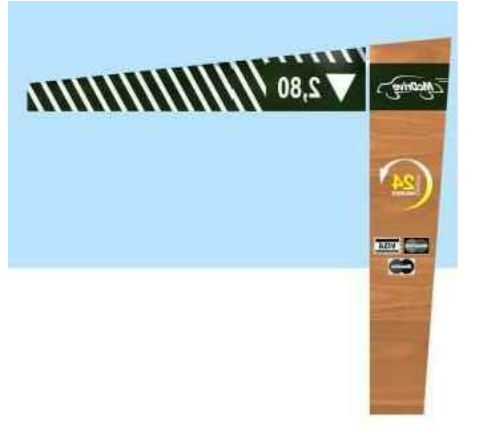
GS-2 GATEWAY SIGN 2 (rechts)