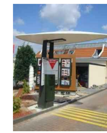
DTC DT CANOPY