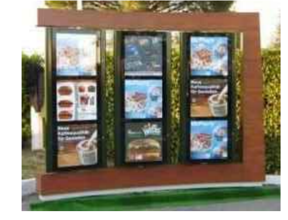
T4-A TOTEM 4A