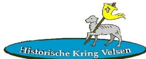
(Historische Kring Velsen)