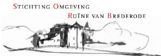
(Stichting Omgeving Ruïne van Brederode)