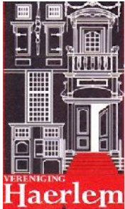
(Historische Vereniging Haerlem)